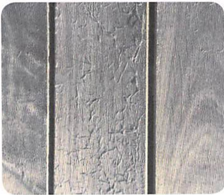
Planken die beschadigd zijn door een hogedrukreiniger (>100 bar) en die een vezelig oppervlak vertonen.

Wij raden ten stelligste aan om vooraf een test uit te voeren op een kleine oppervlakte of op een houtstaal van dezelfde houtsoort als de terrasplanken. Indien de vezels zichtbaar worden of bij vlekvorming of andere schade, in vochtige en droge toestand, is het af te raden om met hoge druk te reinigen! Houtsoorten met een volumieke massa hoger dan 800 \text{ kg/m}^3 zijn gewoonlijk goed bestand tegen deze behandeling.