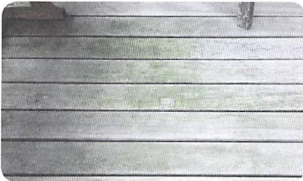
Vorming van groen achter de tafel als gevolg van de gevormde schaduwzone.

Afhankelijk van de glibberigheid en/of het vuil, zal het terras gewoonlijk één tot tweemaal per jaar moeten worden gereinigd. Dit kan gebeuren, liefst in de richting van de draad van het hout (langsrichting van de stroken) met een harde niet metalen borstel (de aanwezigheid van metaal zou een scheikundige reactie kunnen teweegbrengen met de bestanddelen van bepaalde houtsoorten en op het hout vlekken veroorzaken die niet te verwijderen zijn).