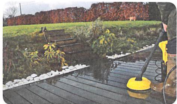
Planken reinigen met een hogedrukreiniger (<100 bar) en een borstel die geschikt is voor houten terrassen.

Het terras reinigen met een hogedrukreiniger kan efficiënt zijn, MAAR de borstel moet aangepast zijn aan houten terrassen en het moet mogelijk zijn om de druk te beperken (<100 bar).